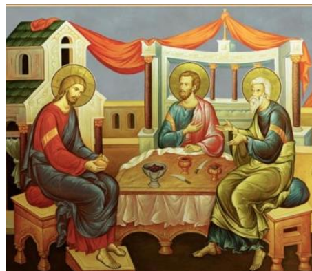
Az emmauszi vacsora