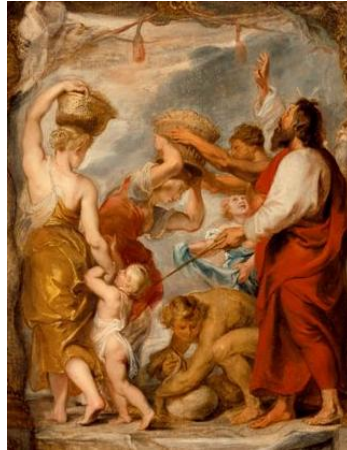
Az izraeliták manná-t gyűjtenek (Rubens)