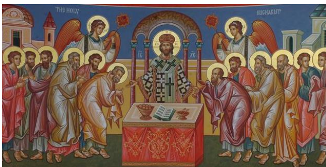
Az apostolok áldozása