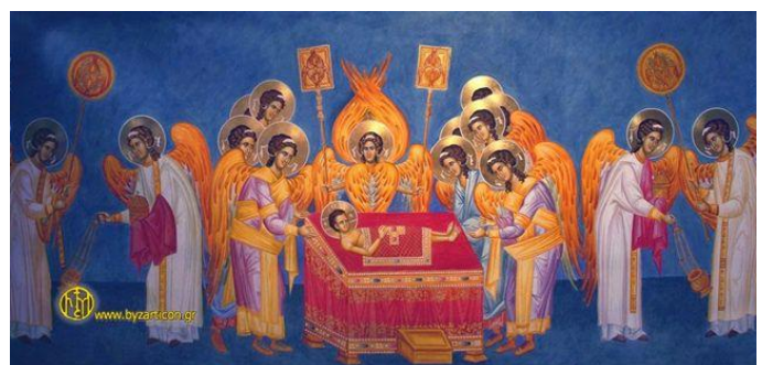
A Szent Liturgia ikonja