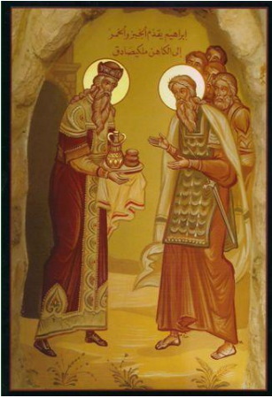
Ábrahám és Melkizedek