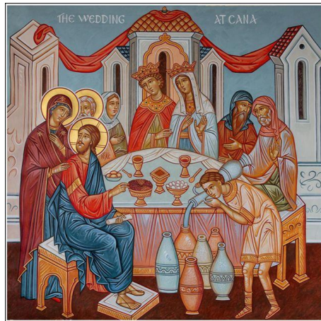
A kánai menyegző